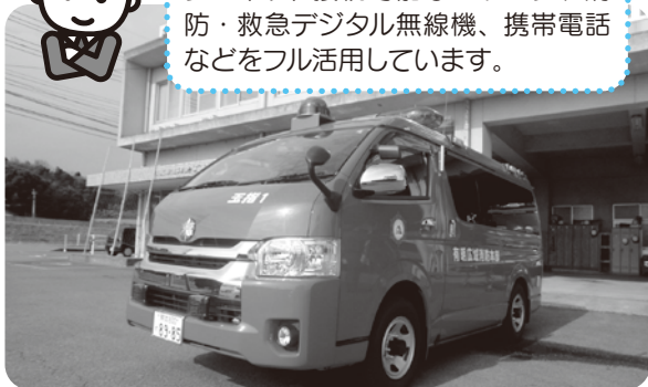
配備された指揮隊車

災害現場で活躍する隊員の安全管理や災害活動を、スムーズに効率よく行うために指揮をする車両です。災害現場では、車載カメラ、インターネット接続可能なパソコン、消防・救急デジタル無線機、携帯電話などをフル活用しています。