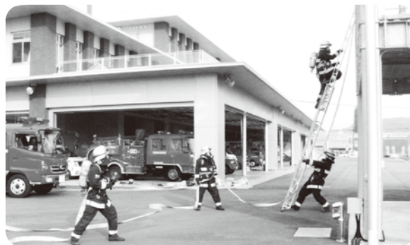
火災防ぎょ訓練中の様子

この訓練は実災害を想定した訓練で、各署・各分署の隊員が連携し消火・救助等を行い災害時の連携強化を図りました。