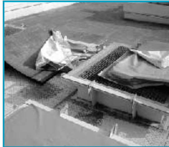
施設屋上の爆風口がカートリッジガスボンベによる爆発で吹き飛ばされた状況

平成21年4月22日(水)午後4時20分ごろ、東部環境センター資源粗大処理施設の回転破砕機の中で、“ドーン”という爆音とともに爆発が起きました。爆発の原因は、スプレー缶等(カートリッジガスボンベ)による爆発事故であると思われます。幸いにもケガ人等はありませんでしたが、いつまた人命に関わる重大な事故につながる恐れがあるかもしれません。ごみ出しには、分別を守り十分に注意して出してください!