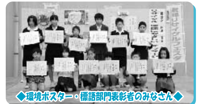
◆環境ポスター・標語部門表彰者のみなさん◆